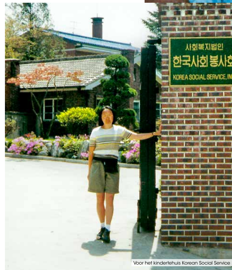
Voor het kindertehuis Korean Social Service

met mij alsof ik een volwassene was en daar ging het mis. Na een ruzie die vreselijk escaleerde wees hij mij de deur. Opnieuw werd ik afgewezen, voor de zoveelste keer stond ik er alleen voor en moest ik mezelf zien te redden. Dankzij mijn karakter en doorzettingsvermogen hield ik vol. Gelukkig ontmoette ik mijn man. We trouwden én ik werd moeder. Een keuze waar ik lang over moest nadenken, want zou ik wel een goede moeder zijn en mijn kinderen kunnen geven wat ze nodig hadden? Ook tijdens mijn zwangerschap was mijn adoptiemoeder er niet voor mij, ik was er echter wel voor haar. Op het moment dat mijn adoptievader overleed werd ik ondanks alles haar mantelzorger. Tien jaar lang verzorgde ik haar en toen